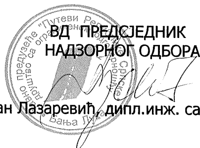
Стојан Лазаревић, дипл.инж. саобраћаја

Ова одлука ступа на снагу даном доношења.